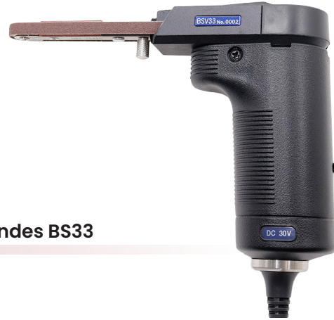
Porte Bandes BS33