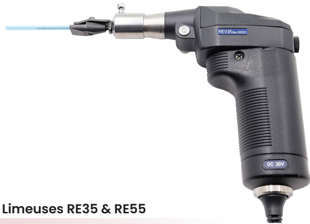
Limeuses RE35 & RE55