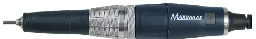
Pièces à main droites